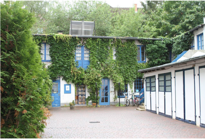
Frontansicht Medusa, Innenhof und Garagen

Über rund 20 Jahre war das Medusa ein lebendiger Veranstaltungsort zwischen Gastronomie und Kultur; ein Raum für Begegnung, Konzerte und gemeinschaftliches Erleben in Gaarden. Seit der Corona-Pandemie ist diese kulturelle Nutzung verstummt; zeitweise diente das Gebäude der Unterbringung von Menschen ohne Obdach. Nun öffnet sich ein neues Zeitfenster: Mit der Kündigung der bisherigen Pachtverhältnisse zum 31.03.2026 und der in Aussicht stehenden fünfjährigen Anmietung durch unseren Verein (mit Verlängerungsoption) entsteht die Möglichkeit, das Medusa von Beginn an neu zu denken und nachhaltig als soziokulturellen Anker im Stadtteil zu verankern.