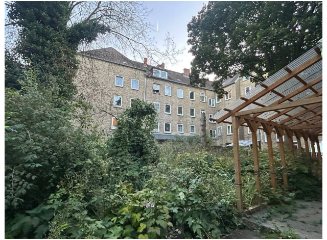
Gartenansicht, September 2025